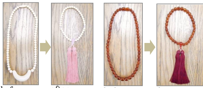
before after 象牙のネックレスを、一部ローズクォーツの珠を加えて、桜色の絹房の珠数に仕立て直ししました。