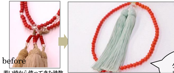
before 若い時から使ってきた珠数。房が焼けてきたのを気になさっていました。

after 娘さんに譲るためつなぎ直して、桜色の絹の房に交換。若い方にふさわしい華やかで明るい珠数になりました。