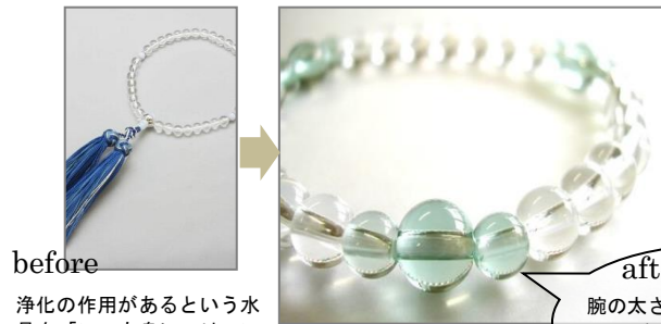
before 浄化の作用があるという水晶を、「いつも身につけていたい」というご希望でした。

after 腕の太さに合わせて、つなぎ直し。アクセントにお好きな石を組み合わせました。