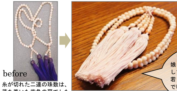
before 糸が切れた二連の珠数は、落ち着いた紫色の房でした。

after 娘さんに譲るためつなぎ直して、桜色の絹の房に交換。若い方にふさわしい華やかで明るい珠数になりました。