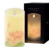
電子ろうそく 本物のろう使用 高さ約 13.5 cm ¥2,750(税込)