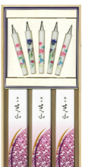
絵ろうそくと線香セット ¥3,300(税込)