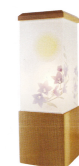
床置型・卓上型 天然木/雁皮紙 高さ約 25.2cm ¥13,200(税込)