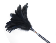
仏壇用毛バタキ ¥935(税込)