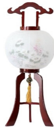
床置型 天然木/絹 高さ約 81cm ¥28,380(税込)