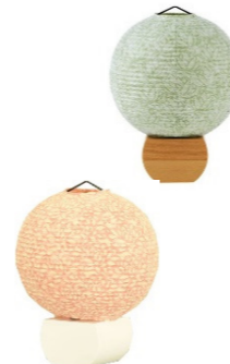
床置型・卓上型 天然木/楮和紙 高さ約 19cm 各 ¥15,400(税込)