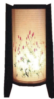
床置型・卓上型 ブナ/絹・美濃和紙 高さ約 30.5cm ¥22,000(税込)