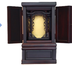
After (高さ 63cm)