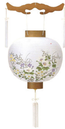
吊り型 焼杉/合成繊維 高さ約 41cm ¥11,000(税込)