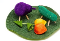
ちりめん精霊馬セット 台座幅約 9.5 cm ¥1,980(税込)

御先祖様の乗り物です。キュウリの馬で早く自宅へ向かい、ナスの牛でゆっくり空に戻ります。