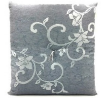
約 59 x 63cm ¥8,250(税込)