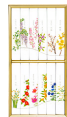
12 種の花の香り線香セット ¥5,500(税込)