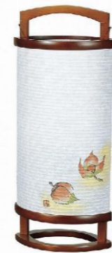
床置型 天然木/和紙 高さ約 57cm ¥29,700(税込)