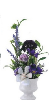
造花アレンジ 高さ約 34 cm ¥6,600(税込)