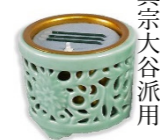
電子線香 瀬戸製 直径約 9 cm ¥11,880(税込)

乾電池式だから、火を使わない安全なおまいりをしていただけます。火災対策に人気です。