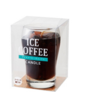
アイスコーヒー ¥825(税込)