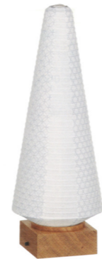
床置型・卓上型 天然木/紙張 高さ約 30cm ¥14,850(税込)