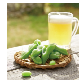
ミニジョッキ 枝豆 ¥825(税込)