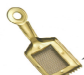
網付き灰ならし ¥1,408(税込)