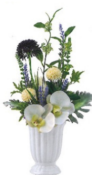
造花アレンジ 高さ約 40 cm ¥7,700(税込)