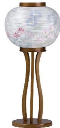
床置型 天然木/絹 高さ約 64cm ¥41,800(税込)