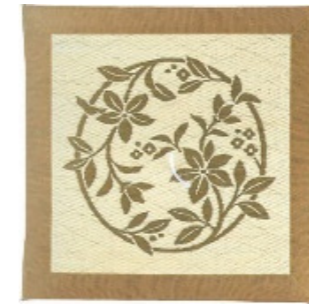
い草座布団 約 68 x 68cm ¥28,930(税込)