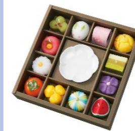
四季 12 か月をモチーフにした和菓子型のろうそくセット ¥4,180(税込)