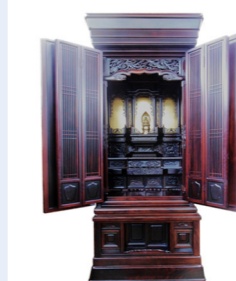
Before (高さ 170cm)

元の素材を生かしながらサイズダウン。ご先祖様から続くお仏壇のおもかげを残して次世代に繋ぎます。