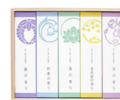
5 種の花の香り線香セット ¥3,520(税込)