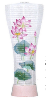
床置型・卓上型 美濃焼/楮和紙 高さ約 53cm ¥14,300(税込)