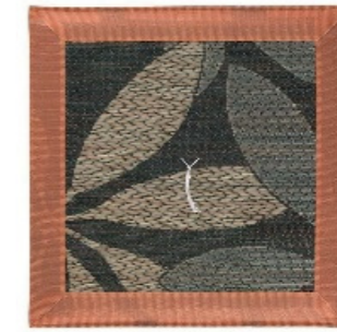
い草座布団 約 65 x 65cm ¥16,170(税込)