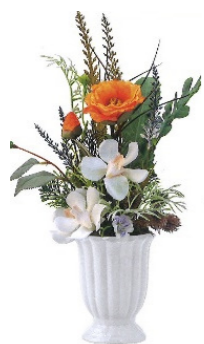
造花アレンジ 高さ約 40 cm ¥7,700(税込)