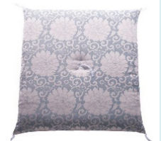
約 64 x 67cm ¥12,375(税込)