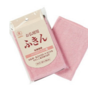
仏壇用ふきん ¥363(税込)